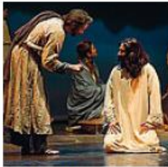
La rock opera il 25 aprile in Arena

Tra questi l'Elemosineria apostolica del Vaticano e la Caritas diocesana di Verona, per i progetti legati all'Emporio della Solidarietà. Al netto dei costi, che saranno contenuti: il Comune di Verona ha infatti concesso l'Arena in uso gratuita. Lo spettacolo, scritto da Tony Labriola e Stefano Govoni, debutterà in Anfiteatro il 25 aprile alle 21 e si preannuncia come una vera e propria novità in fatto di musical. Al centro, c'è la storia dell'apostolo Pietro, che si apre con un flashback mentre è recluso al Mamertino.